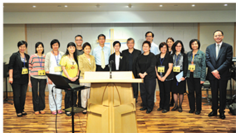
健關講座——「照顧者生命質素與成長」大合照